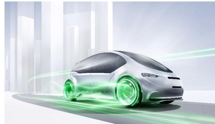
Powertrain systems and electrified mobility