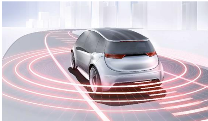
Automated mobility / Автоматизирана мобилност