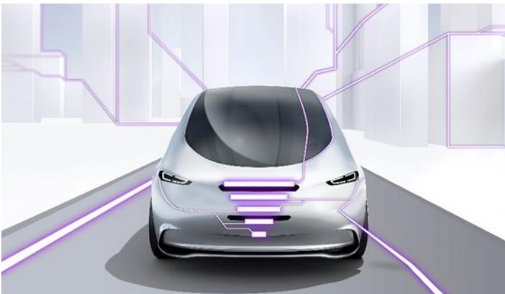
Connected mobility / Свързана мобилност